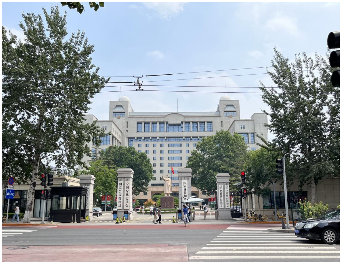
国家林草局、湿地公约第 14 届缔约方大会执行委员会办公室外景图