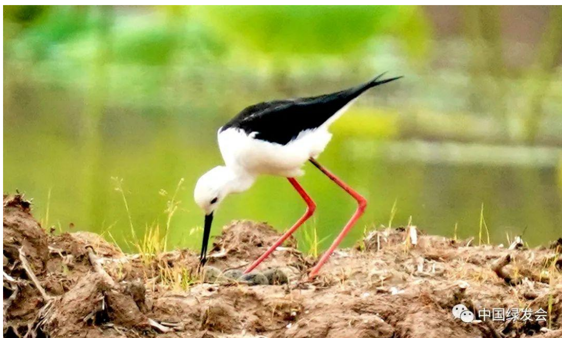
湖北轮作的藕田人工湿地的勃勃生机。

据了解，此次《国际湿地公约》第十四届缔约方大会的开幕式和高级别会议将采用线上+线下混合模式，受邀代表们可通过视频方式参与。目前，由中国绿发会国际部负责筹备的这两场边会的各项事宜正在积极稳妥推进。中国绿发会也欢迎来自国内外社会各界人士的关注与支持。