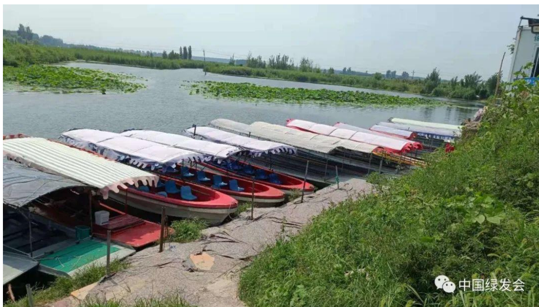
华北之肾——白洋淀湿地。