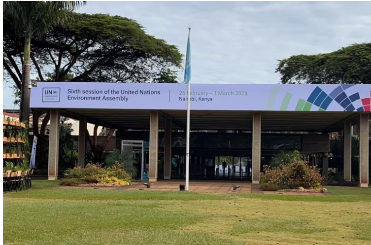
第六届联合国环境大会（UNEA-6）。